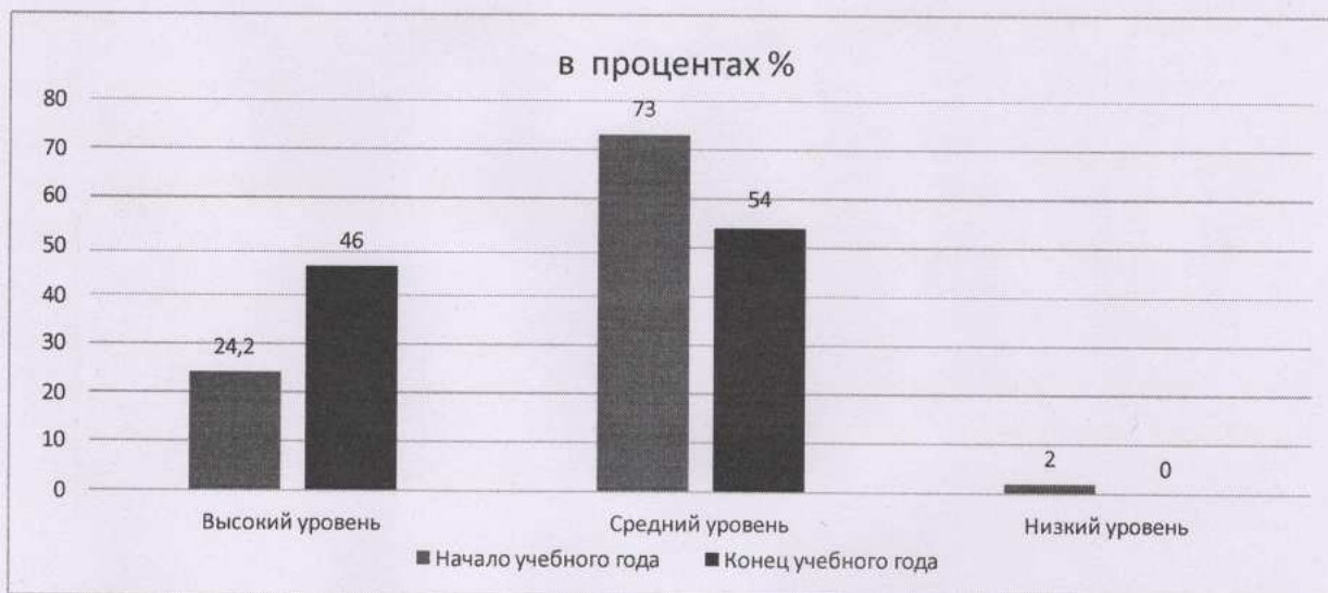
Результаты усвоения образовательной программы выпускниками ( в процентах %)

По итогам проведен мониторинг реализации образовательной программы для определения приоритетных направлений образовательной деятельности на 2024 год. Мы можем говорить о том, что по всем образовательным областям удалось получить положительную динамику освоения ООП ДО. Образовательная деятельность в 2023 календарном году реализована в 100 % объеме в соответствие с современным законодательством, с учетом возрастных и индивидуальных особенностей дошкольников.